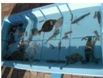
タッチングプール

・海の生き物に直接触れる ことのできるタッチング プールや魚の水槽展示な どをご用意しております。